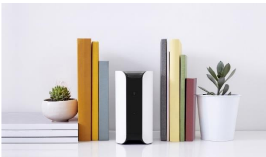
Canary macht in jeder Wohnsituation eine gute Figur: bei BRACK.CH ist das Gerät in Schwarz oder Weiss erhältlich

Mägenwil, 21. März 2017 – Canary ist Sicherheitskamera, Bewegungsmelder, Luftqualitätssensor und Sirene in einem. Übers Mobiltelefon können Benutzer jederzeit auf Bild und Ton zugreifen, die Sirene auslösen oder Einsatzkräfte alarmieren. Das dank Crowdfunding realisierte Gerät ist auf besonders einfache Installation und Bedienung ausgelegt. Canary ist ab sofort für 229.– Franken beim Online-Fachhändler BRACK.CH ab Lager erhältlich.